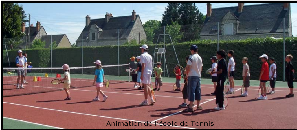
Animation de l'école de Tennis