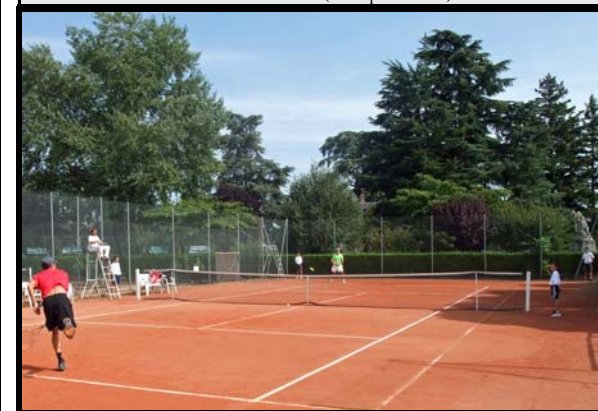
Des ramasseurs de balles au Tournoi Open 2009 ( voir p 13).